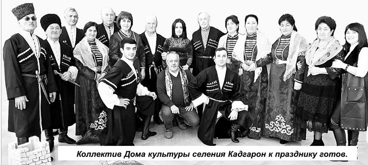
Коллектив Дома культуры селения Кадгарон к празднику готов.

Кто своим творчеством зажжет в сердцах людей радость, создаст праздничное настроение и поможет увидеть прекрасное в обыденном мире? Конечно, работники культуры! Верно служа искусству, даря свой талант и мастерство, привнося в нашу жизнь свое творчество, они заставляют забыть о повседневных проблемах и наполняют нашу жизнь незабываемыми впечатлениями. Накануне дня профессионального праздника работников культуры особенно хочется отметить тех, кто скрашивает досуг сельским жителям. В их числе — коллектив Дома культуры с. Кадгарон.